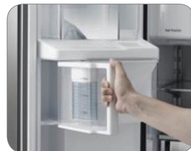
Remplissage d'eau automatique